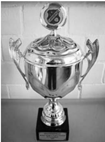
Der von Walter Reegen gestiftete Wanderpokal

Constantin Wagener nimmt es gleich mit drei Lützelsachsener Kickern auf. Im Viertelfinale scheiterte die 1. Mannschaft dann allerdings an den an diesem Tag bärenstarken Schriesheimern, die bis ins Finale kamen