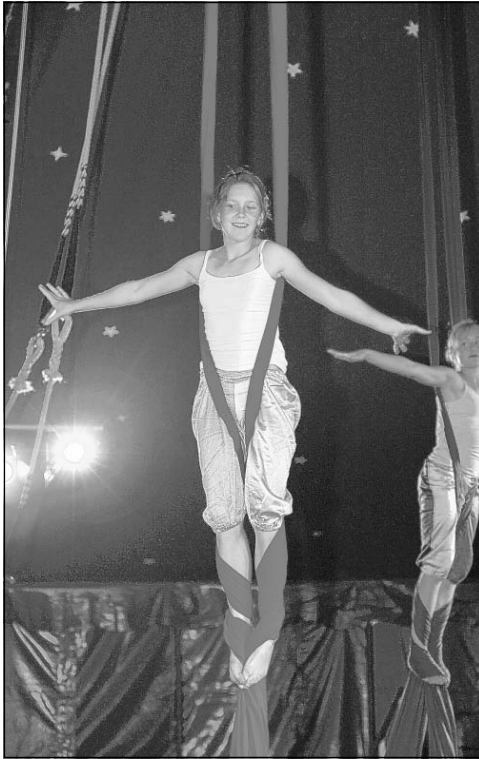
Die Kinder werden im Zirkus Sorriso zu richtigen Artisten ausgebildet

(dyh). 2001 fand es zum ersten Mal statt, und die Hartnäckigkeit der Veranstalter vom Walldorfer Jugendkulturhaus JUMP mussten einen langen Atem beweisen, um das Zeltspektakel auf dem Festplatz beim Tierpark zu dem zu machen, was es heute ist.