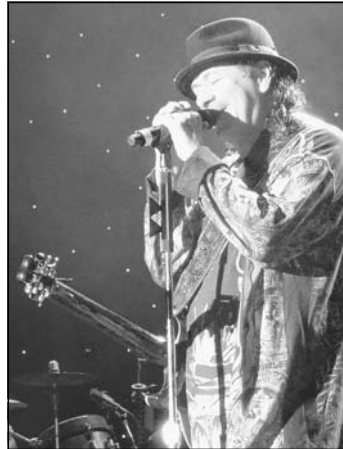
Seit vier Jahrzehnten steht der 63-jährige Gitarrist und Sänger auf der Bühne

Publikum mit seinen neuesten Liedkreationen zu langweilen - wie das manche in die Jahre gekommenen Oldie-Künstler gerne zelebrieren - bot Santana seinem Publikum das, was es hören wollte: die Ohrwürmer „Black Magic Woman“, „Oye como va“ und „Maria, Maria“. Das Ganze aber vielleicht eine Spur zu laut, da ja die 7.700