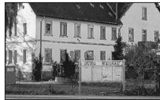
Bei der Schlossmühle befinden sich die Überreste der Burg Wersau

der möglich sein, einen Blick auf Teile der bereits legendären „Burg unter der Grasnarbe“ zu werfen. Ein vielfältiges Programm erwartet die Besucher an der Schaustelle: So wird es zur vollen Stunde vom Grabungsteam des Landesdenkmalamtes Führungen und Erläuterungen zu den einzelnen Grabungsbereichen geben, jeweils zur halben Stunde gibt es verschiedene Vorträge zur Burgen- und Heimatgeschichte. Wer sich für archäologische Grabungsarbeiten interessiert,