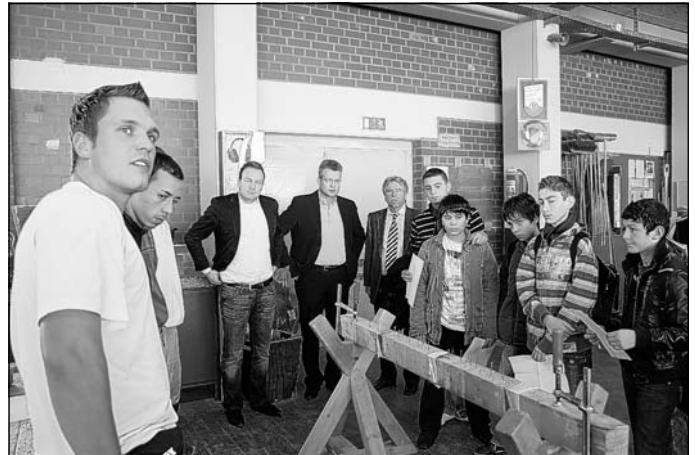
Im Rahmen von Führungen durch die Werkhallen konnten die Schüler anhand kleiner praktischer Aufgaben ihr handwerkliches Geschick testen

Anlässlich des Veranstaltungsjubiläums fanden im Rahmen des diesjährigen Informationstages in allen beteiligten Ausbildungszentren Infotag-Meisterschaften statt. So konnten die Schülerinnen und Schüler in Mannheim bei praktischen Wettbewerben ihre Begabungen im „Wettplastern“ erproben. Die Sieger wurden