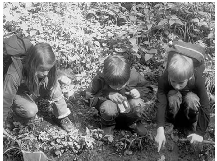
Auf Spurensuche