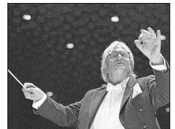
Justus Frantz

Musiker aus 40 Nationen und fünf Kontinenten treffen hier mit ihrem Dirigenten Justus Frantz zusammen. Das Geheimnis ihrer friedlichen Koexistenz ist ihre gemeinsame Sprache – die Musik. Justus Frantz gelang es, aus dem Orchester einen Klangkörper mit Weltniveau zu formen. Besinnliches und Stimmungsvolles, beliebte Kompositionen und selten gespielte Kostbarkeiten finden sich im Konzertprogramm mit Werken unter anderem von Johann Sebastian