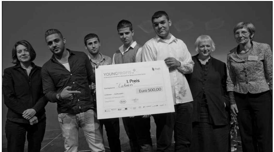
Über ein Startkapital in Höhe von 500 Euro zur Umsetzung des Projekts „Leben“, mit dem Jugendliche von der Straße geholt werden sollen, konnten sich vier Schüler der Julius-Springer-Schule Heidelberg freuen

Gleich beim ersten Vortrag des Tages konnten die Besucher vom reichen Erfahrungsschatz eines der bekanntesten